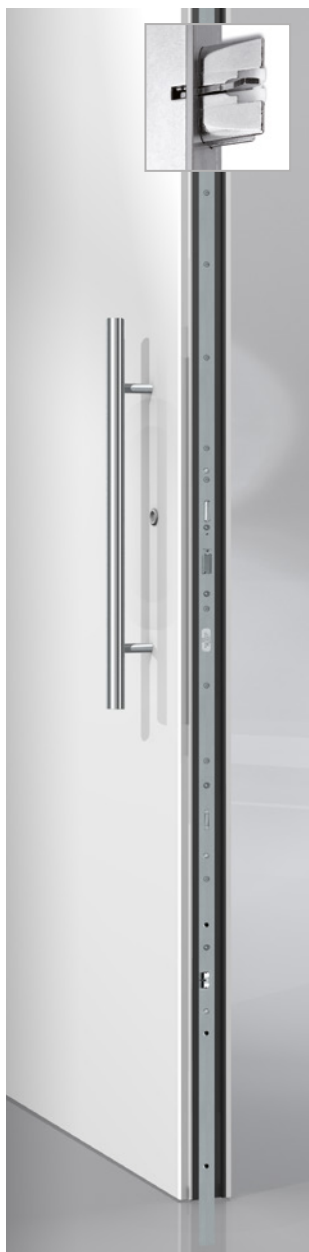
ES 1100 GU Automatic 3-fach Verriegelung hellverzinkt mit durchlaufender verstellbarer Schließleiste